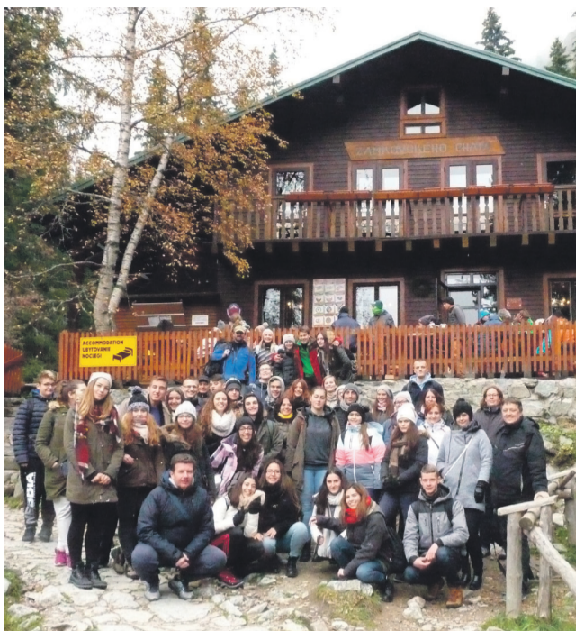
Vo Vysokých Tatrách

Odniesli si množstvo zážitkov.