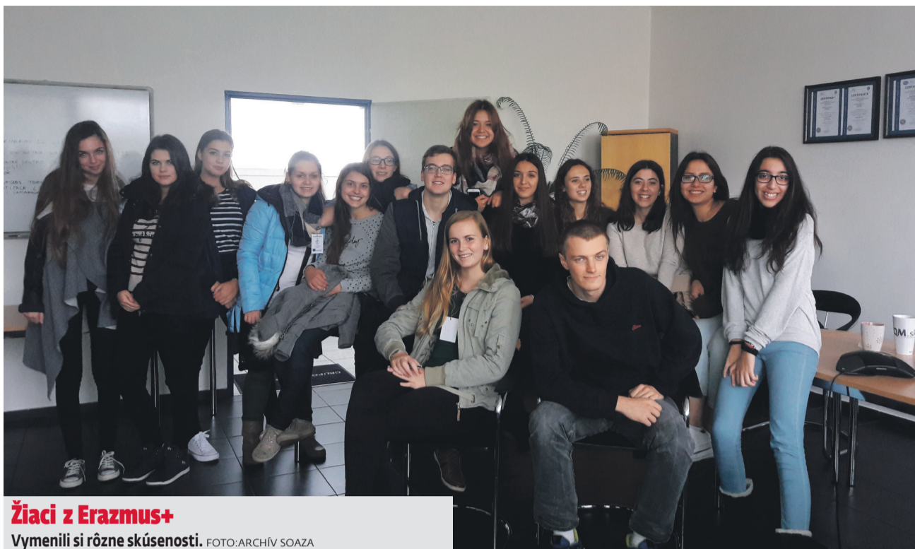
Žiaci z Erasmus+

Odniesli si množstvo zážitkov.